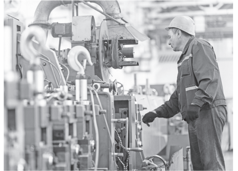
В январе - июне на поддержку реального сектора экономики из областного бюджета выделено 10,1 миллиарда рублей, что на 17,5% больше, чем за I полугодие прошлого года.

Расходы за январь - июнь составили 43,8 миллиарда рублей, что на 3,4 миллиарда больше аналогичного периода прошлого года. На выплату заработной платы с начислениями направлено более 7 миллиардов